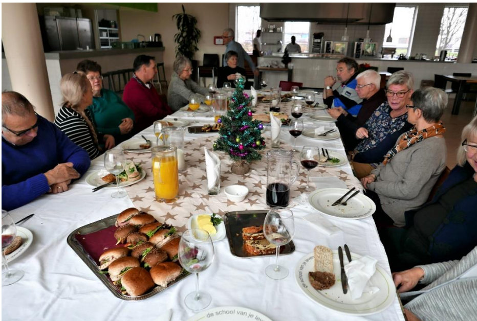
21 december, Life-Lentiz College

Naast een lunch in ons eigen gebouw waren we op 21 december weer te gast bij het Life-Lentiz College voor een feestelijke Kerstlunch (geserveerd door studenten), waarbij ook de gebruikelijke Kerstattenties werden uitgedeeld.